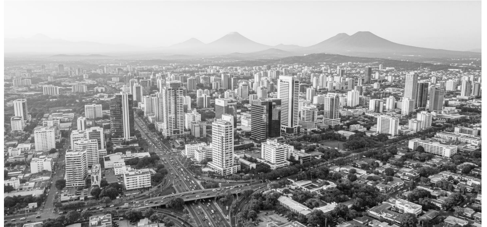
Ciudad San Salvador